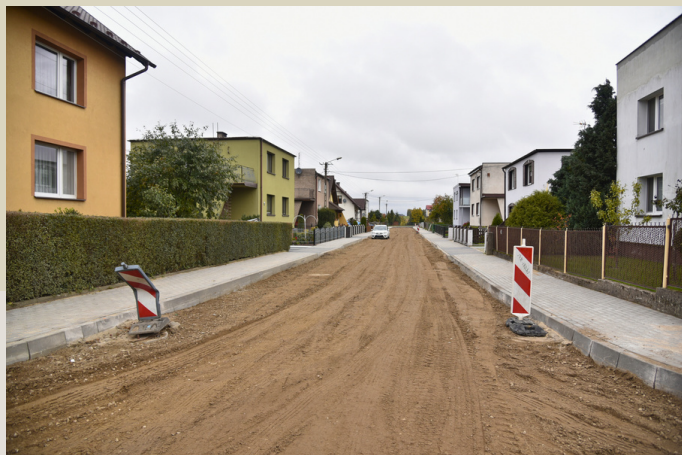
ul. Bolesława Prusa

Pierwszy etap został zrealizowany w 2021 roku i dotyczył budowy kolektora deszczowego w ciągu ulicy Kalwarynej i części ulicy Dworcowej. Umożliwiło to podłączenie do instalacji osiedla Słonecznego, na którym w tym samym czasie trwała budowa ulic. Wykonany został już także etap w obrębie oczyszczalni ścieków i dobiega końca realizacja zadania w rejonie osiedla Słowackiego.