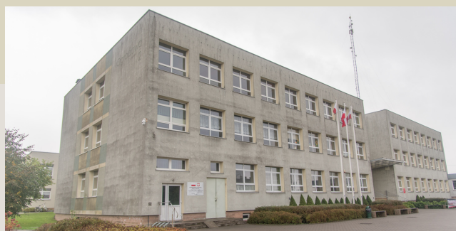
Szkoła Podstawowa im. Jana Pawła II w Brusach